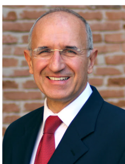
FABIEN SUDRY - Préfet de la région Bourgogne-Franche-Comté

Avec France relance, l'État investit pour construire la France de 2030 : plus écologique, plus compétitive, plus solidaire dans laquelle nous allons tous nous retrouver.